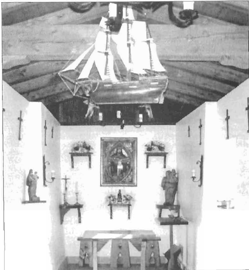
Ermita de San Salvador.

Son cinco los exvotos marineros que penden de las bóvedas o techos de las iglesias y ermitas de Deba, si bien algún otro tras su deterioro por la acción del tiempo y la humedad y ante la indiferencia general, acabó por desaparecer.