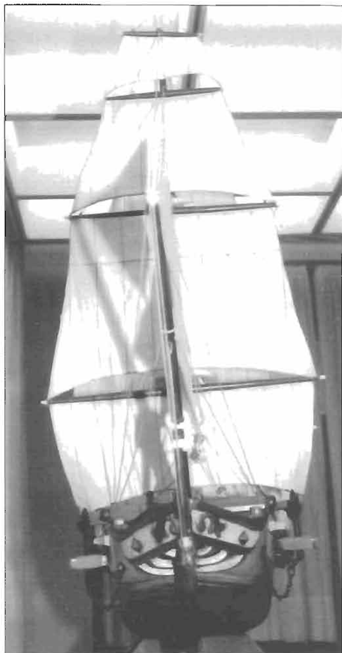
Vistas de proa y popa del exvoto de la Iglesia Santa María de Deba.

Este detalle da a conocer que el autor del exvoto no fue muy ducho en este tipo de trabajo, aunque pudiera haber sido un gran marino.