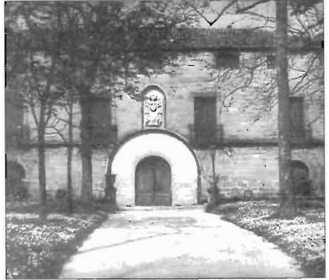
Palacio Narros (Zarautz). Junto con Zumaya, otro de los primeros emplazamientos de los Gamboa.