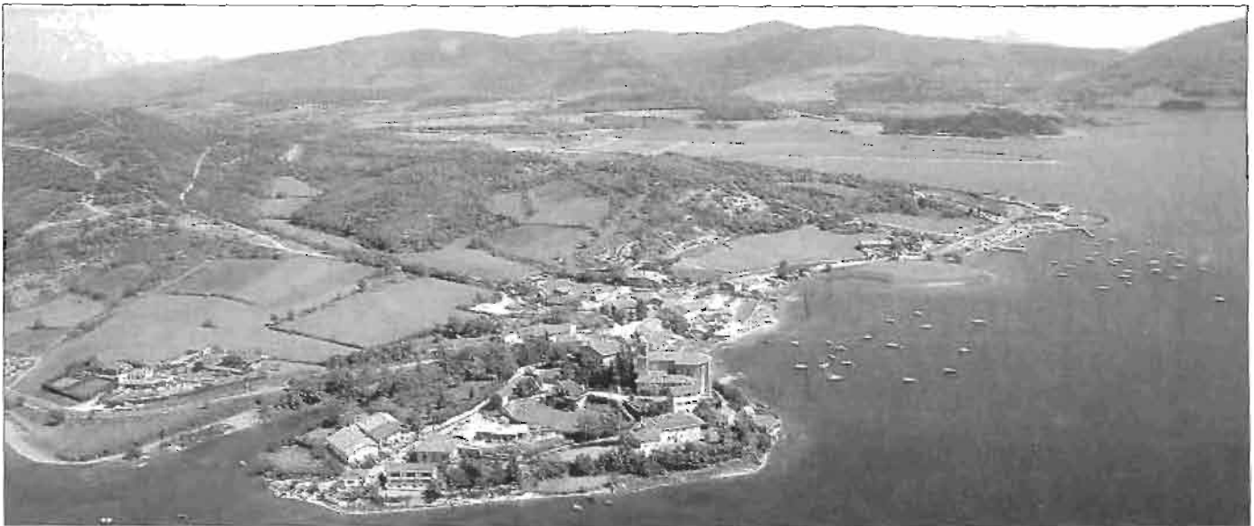
Uibarri-Gamboa: lugar y origen del ilustre linaje Gamboa.