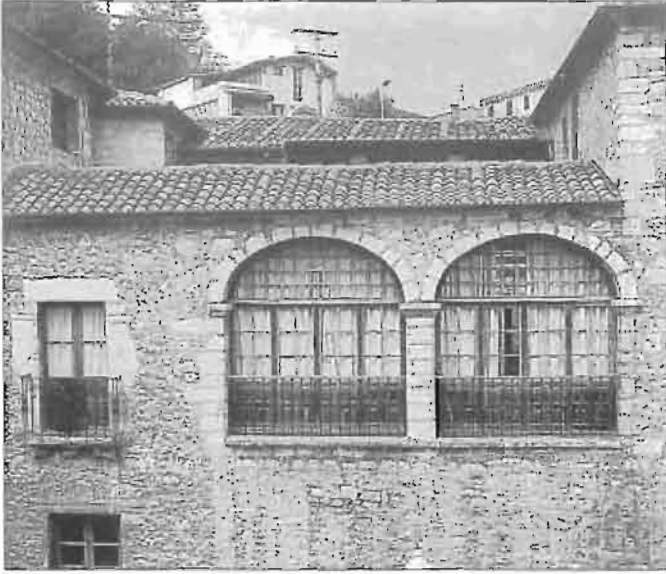
Palacio Gamboa (Zumaya). Primera casa guipuzcoana donde se establecieron los Gamboa desde tierras alavesas