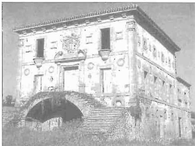
Palacio Acheaga (Usurbil) Casa solar con quien entroncaron los Gamboa