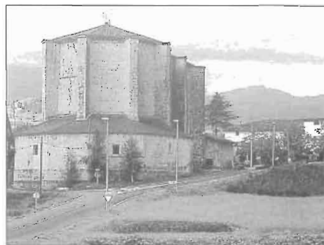
San Millán (Zizurkil). Lugar en el que se libró una gran batalla.