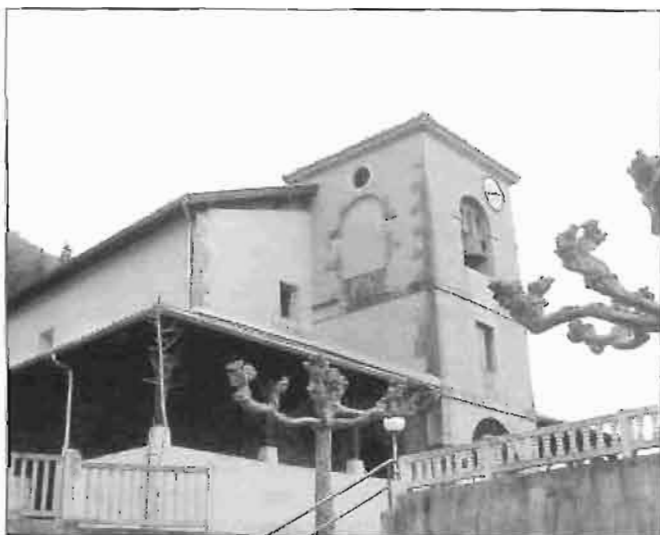
Iglesia Garagarza de mediados del S. XV.

Ante esta situación intervino la provincia, acordándose en las JJ.GG. celebradas en Usarraga el 19 de septiembre de 1.462, el nombramiento de tres procuradores en calidad de arbitros.