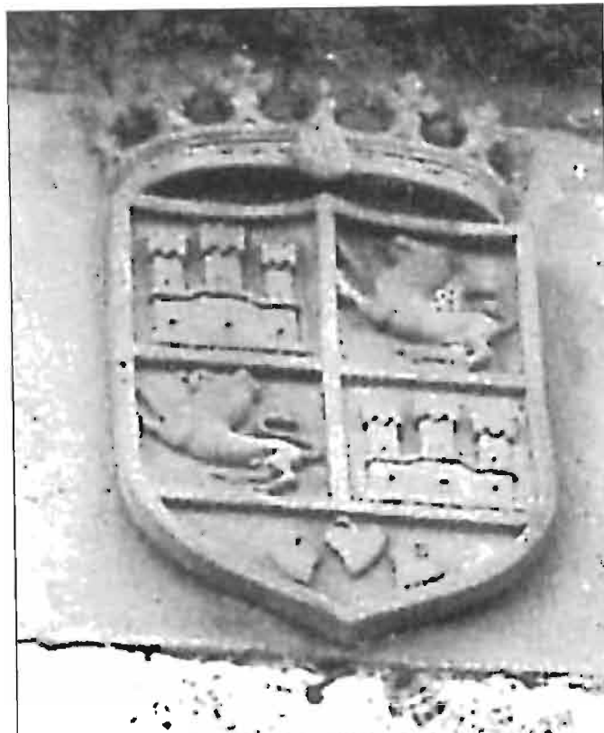
Escudo de Ospaz en la fachada de su casa.

Pero estos temas se desarrollarán en los siguientes capítulos.