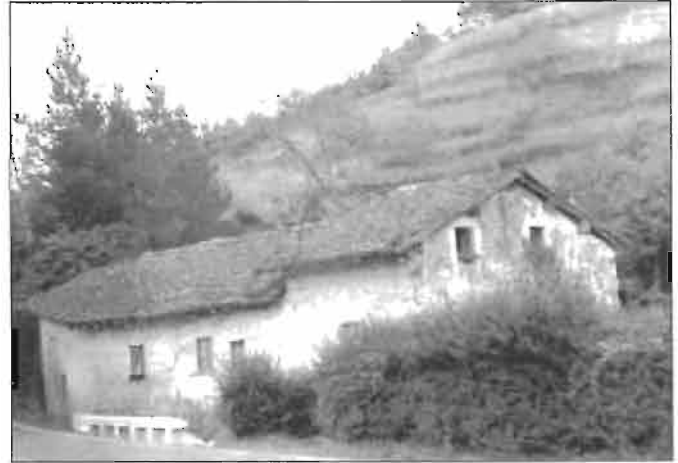
Antigua ferrería La Plaza a orillas del río Intxusaí.

Desempeñó notables comisiones de la Corona, a destacar que la reina Dña. Juana lo designó para que acompañase al Condestable de Castilla en 1.530, cuando fue a Francia para hacer entrega a Francisco I de sus hijos, que habían quedado en Francia en calidad de rehenes.