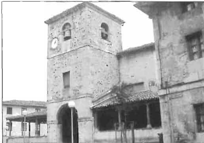
Iglesia de Azpilgoeta, del S. XIV, de origen perteneciente a los señores de Olaso.