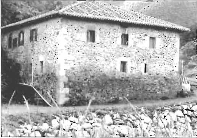
Ferrería Artañola propiedad de los Olaso.

En todo el entramado de enlaces, tiene especial relevancia el matrimonio con la rama Andía de Tolosa, Marqueses de Valparaíso, Villahermosa Busianos y de La Pica; Vizcondes de Santa Clara de Avedillo y "Grandes de España"