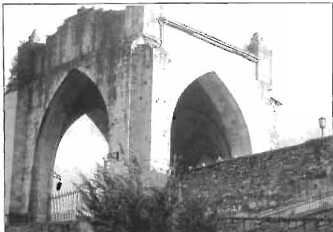
Portal gótico de la primitiva iglesia de San Bartolomé propiedad de los Olaso.

Tal es el caso del Bº de Azpilgoeta de Mendaro que, prácticamente, era de su absoluto dominio, comenzando por el patronato de la iglesia de la Asunción, las dos ferrerías de Aurteñola y La Plaza, poniendo la guinda en la casa-torre de Ospaz, su segundo palacio, lugar de esparcimiento y de pesca de variadas especies. Ello dio pie a diversos pleitos que el historiador D. Félix Elejalde justifica porque "conocidas las especialidades del río: salmones, truchas, etc., cualquiera hubiera sucumbido a la tentación" .