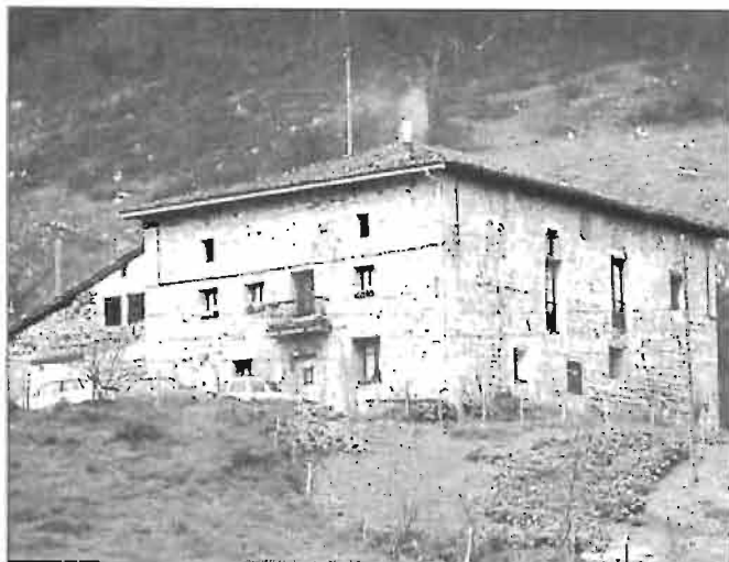
Casa torre Ospaz.

La actuación de dichos procuradores permite el otorgamiento de una escritura de concordia, firmada delante de la ferrería de Gabiola el 20 de octubre de 1.462, que ratifica el "Contrato Viejo", declarando el monte Arnoguibel, libre y abierto a los vecinos de Elgoibar, para nueva satisfacción de los Srs. De Olaso.