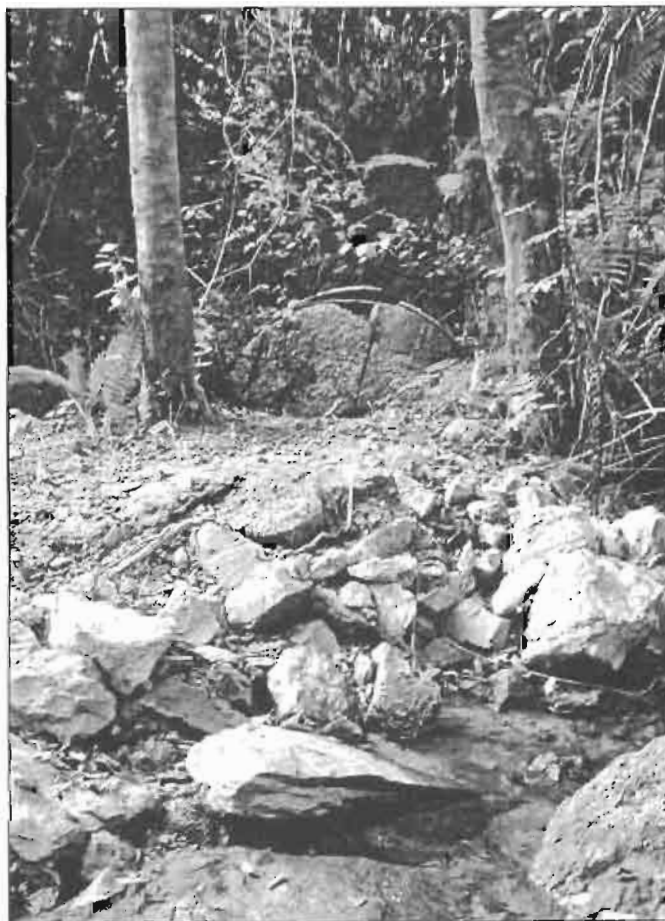
Restos del molino de Aristondo.

Según los datos obtenidos del libro titulado Ferrerías Guipuzcoanas (4), en el año 1475 están citados la existencia de más de dos molinos (pág. 463): el de Juan de Ugarte y los cercanos de Goikola, con motivo de la denuncia de aquel por perjudicarle las obras de reforma en la presa de Arrextondo que hizo Juan Ruiz de Irarrazabal, dueño de la ferrería de Goikola.