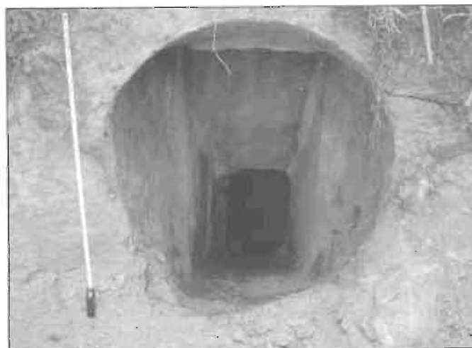
Boca de entrada de la tobera.