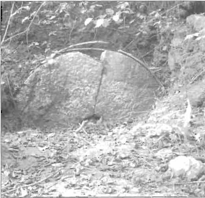
Detalle de la piedra del molino de Anstondo