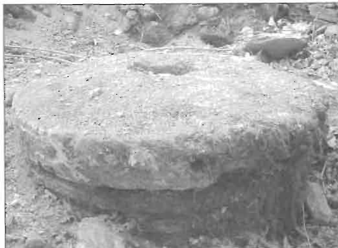
Detalle de la piedra de moler