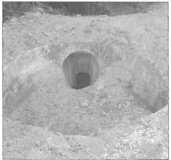
Antepera circular del molino cercano a Gokola.