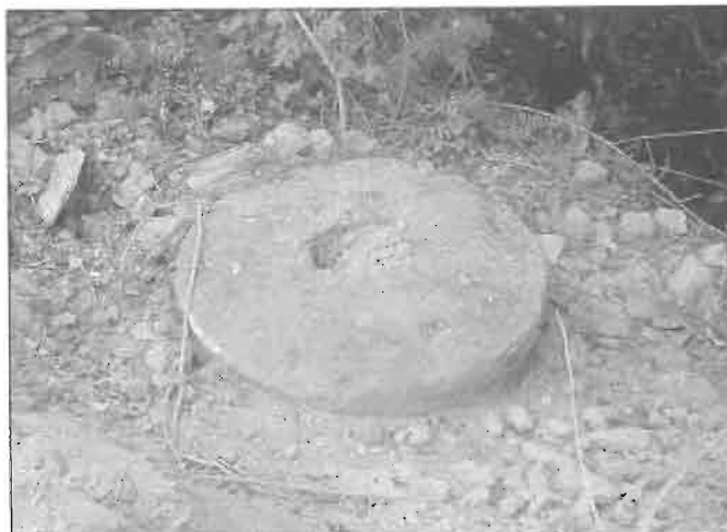
Restos de la sala del molinero.