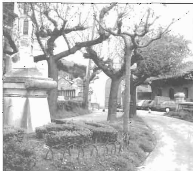
Estatua de Fermín Calbetón rodeada de un cierre de arcos de hierro, colocado en 1919.