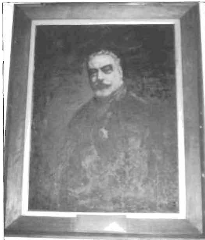
Retrato de Fermín Calbetón encargado por el Ayuntamiento de Deba, el año 1921, al pintor eibarrés Jacinto Olave, y colocado en el salón de plenos.

Consagremos la ofrenda de afecto al constante y leal bienhechor, que este pueblo como hijo predilecto por su grande bondad le aclamó. Por su grande bondad le aclamó