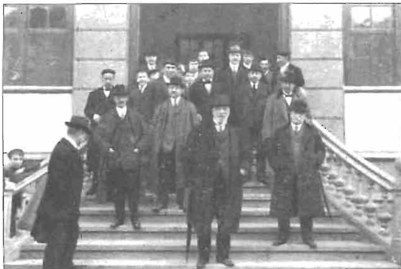
Visita del Excmo. Sr. D. Fermín Calbetón a los locales de la primitiva Escuela, situada en el Frontón Viejo (Año 1912).