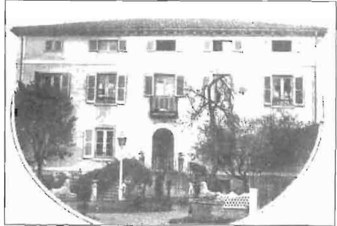
Casa Palacio de D. Francisco Lersundi, en Deba.

En 1.866, el General O'Donnell temiendo ser sustituido en la Presidencia del Gobierno por Lersundi, consiguió desplazarle, nombrándole Gobernador Capitán General de Cuba. El 10 de abril de 1.866 se expide el Real decreto siguiente: " En atención a las particulares circunstancias que concurren en el Teniente General Lersundi, vengo a nombrarle Gobernador Capitán General de Cuba. " Tomó posesión de su cargo el 30 de mayo, sustituyendo al General Domingo Dulce. (19)